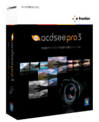
ACDSee Pro 3